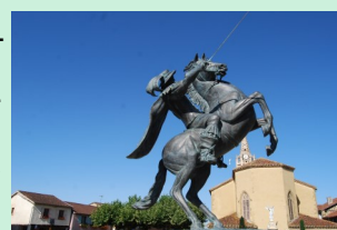
Statue de d'Artagnan à Lupiac

Jour 5 : Départ de Saint-Arailles. Journée d'environ 25km pour arriver à Lupiac. Photo souvenir devant la statue de d'Artagnan. Retour à Gimont en fin d'après-midi.