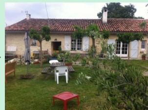
Croisée de Saint-Cricq

Jour 3 : Départ de Mirepoix. Journée d'environ 25km pour arriver à Auch, à la croisée de Saint-Cricq, pour la nuit.