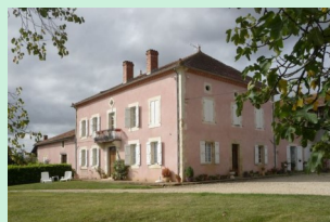
Chambre d'hôtes n°32G100912

Jour 4 : Départ de Auch pour une journée d'environ 35km jusqu'à Saint-Arailles où vous passerez la nuit en chambre d'hôte.