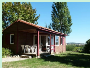
Chalet des mousquetaires

Jour 2 : Départ de Magnas pour une journée d'environ 35km jusqu'à Mirepoix où vous passerez la nuit aux chalets des mousquetaires.