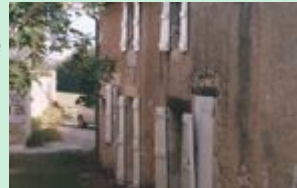
Domaine de Magnas

Jour 1 : Départ à cheval de Lavit. Randonnée d'environ 25km jusqu'au Domaine de Magnas où se passera la nuit.